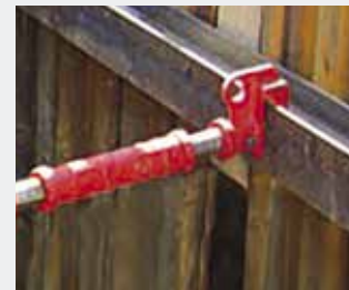
Tastwinkel – Sonderlösung